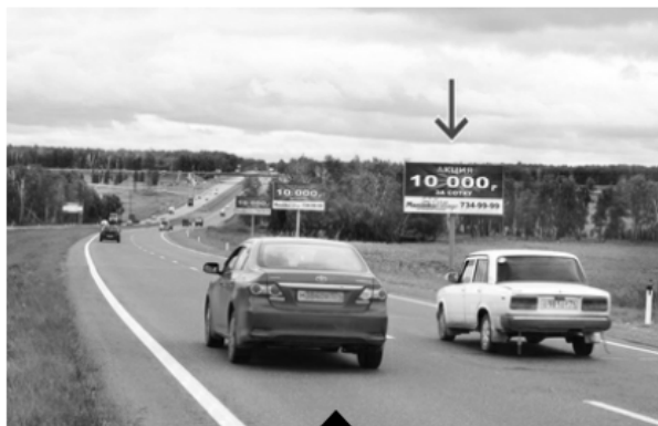
Сторона А (выезд)