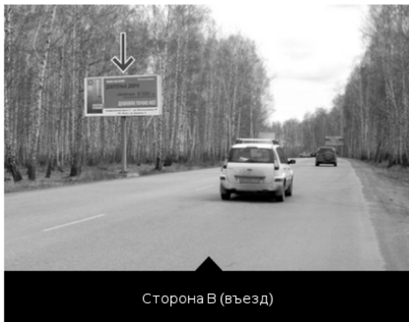
Сторона В (въезд)