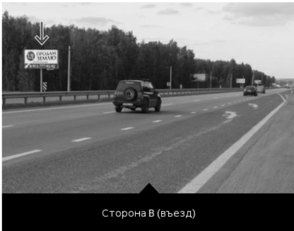
Сторона В (въезд)