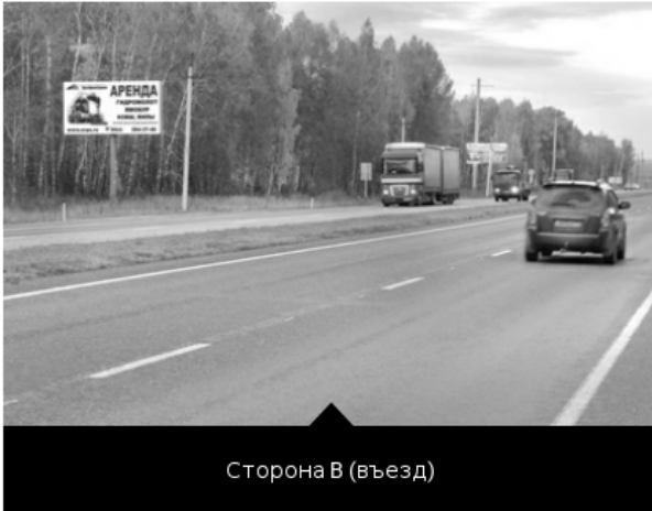
Сторона В (въезд)