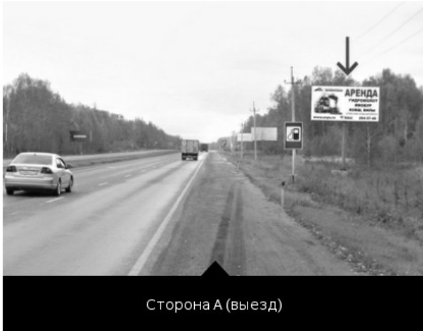
Сторона А (выезд)