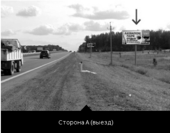
Сторона А (выезд)

Уфимский тр., 15 км. + 930 м. (1863 + 070)