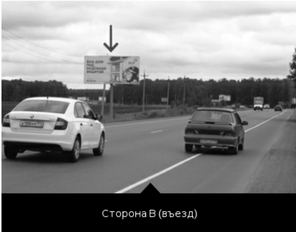
Сторона В (въезд)