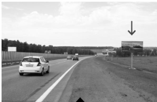
Сторона А (выезд)