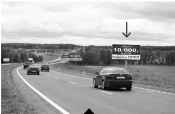
Сторона А (выезд)